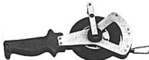
Slika 3: Mjerilo tipa 464-V